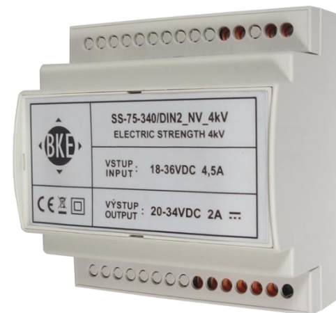
Ilustrační foto Illustrative photo Illustration Foto

CZ: Napájecí zdroj – DC/DC konvertor - Návod k montáži a obsluze EN: Power supply - DC/DC konverter - Operating and installation instructions DE: Stromversorgung - DC/DC Wandler - Bedienungsanleitung