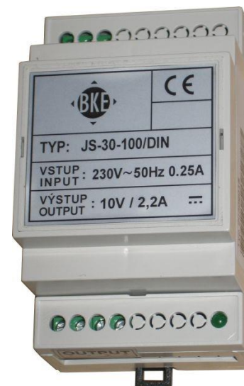
Ilustrační foto Illustrative photo Illustration Foto

CZ: Napájecí zdroj - Návod k montáži a obsluze EN: Power supply - Operating and installation instructions DE: Stromversorgung - Bedienungsanleitung