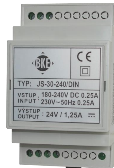
Ilustrační foto Illustrative photo Illustration Foto

CZ: Napájecí zdroj - Návod k montáži a obsluze EN: Power supply - Operating and installation instructions DE: Stromversorgung - Bedienungsanleitung